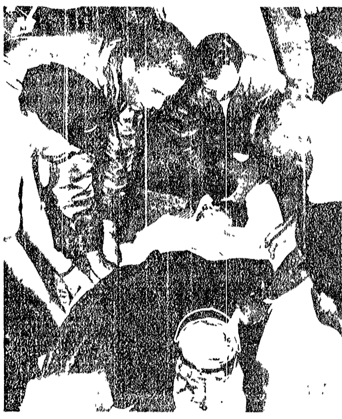
MIAIMI Il numero dei morti accertati e dei dispersi, che al tempo sono dereduti nell'affondamento della nave crociera "Yarmouth Castle" è salito a 84. Un altro passaggero è infatti morto all'ospedale di Nassau per le ustioni riportate nell'incendio della nave. I passeggeri feriti in salvo degni all'ospedale di Nassau sono attualmente 19. Nella foto: una donna non identifiata, trasferita dall'aereo in un'autoambulanza al suo arrivo a Miami di Nassau.