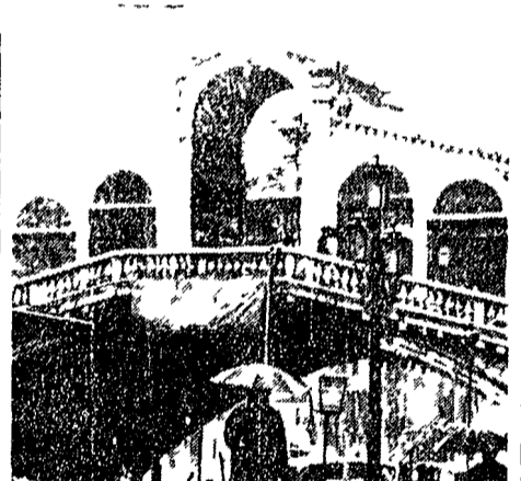
VENEZIA - Alcuni passanti sorpresi dalla prima nevicata nei pressi del ponte di Rialto

GENOVA - Un vento impetuoso con raffiche di 75 km all'ora ha battuto la città da tutta la notte. Il maltempo è accompagnato da venti furiosi e mareggiate.