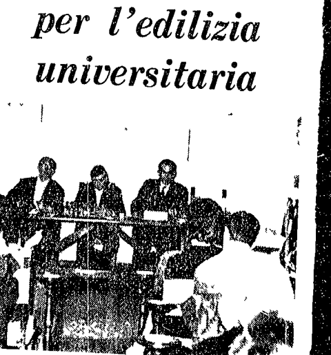
Gruppo di persone sedute a tavola.