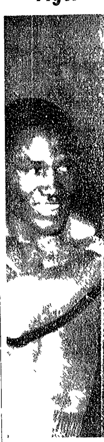
NEW YORK, 25