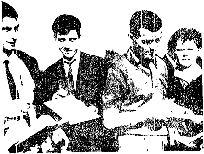
GUARNERI (a sinistra) e CORSO, i due azzurri che hanno avuto il permesso di andare in Romania con l'Inter vuol dire che Fabbri non intende utilizzarli?

L'Ufficio stampa della FIGC ha informato ieri che la Federazione ha comunicato alla FIFA ed alle Federazioni del proprio gruppo eliminatorio (Scotia, Polonia e Finlandia) per la qualificazione ai campionati del mondo del prossimo luglio in Inghilterra, l'elenco dei 22 giocatori presenti per la partita Italia-Scotia del 7 dicembre prossimo a Napoli. Questo è l'elenco: Enrico Albertoni, Roberto Anzolin, Paolo Barison, Mario Baruzzi, Giancarlo Berzelino, Bruno Bolchi, Giacomo Bulgarelli, Tarcisio Burgnich, Mario Corso, Virginio De Paoli, Angelo Donenghini, Giacinto Facchetti, Adolfo Gori, Aristide Guarneri, Giovanni Lodetti, Sandro Mazzola, Bruno Mora, Ezio Pascutti, Gianni Rivera, Roberto Rosato, Sandro Salvadore, Giovanni Trapattoni e a assai largo, ma per una ragione ben precisa, perché secondo i regolamenti della FIFA la nazionale dovrà essere formata entro la «ora» di questi 22 nomi (che comprendono quindi probabili titolari e probabili riserve). Comunque mercoledì prossimo Fabbri farà risentimento comunicando lo elenco dei giocatori convocati per la preparazione a Coverciano (un elenco che dovrebbe comprendere 18