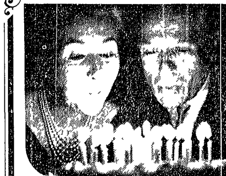
quando Lui e Lei sono una cosa sola

NAONIS lavatrici * televisori * frigoriferi * cucine