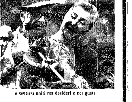
e sentirsi uniti nei desideri e nei gusti