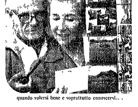
quando volersi bene e soprattutto conoscersi...