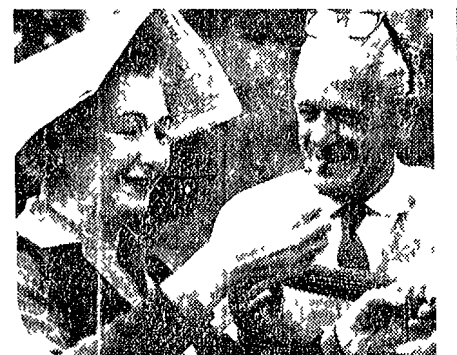
ed ogni giorno ha la freschezza del primo