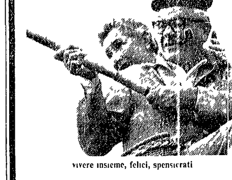
vivere insieme, felici, spensierati