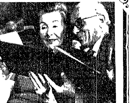
quando volersi bene significa vivere bene