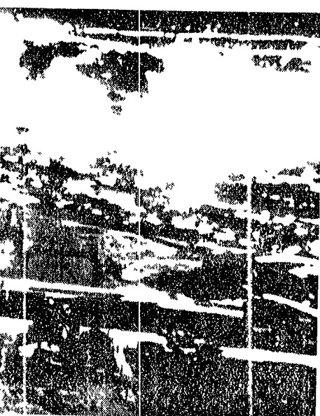
EL PASO (Texas) - Veduta dall'alto, da bassa quota, della città di El Paso con le strade illuminate dai fari delle macchine di passaggio

buio per due ore Anche numerose città del Messico sono rimaste senza luce Johnson ordina una inchiesta Bloccate quattro basi militari