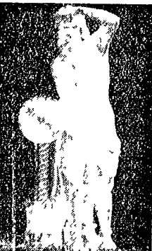
Archimede, con lo specchio ustorio, mentre aspetta al varco la flotta del romano Marcello