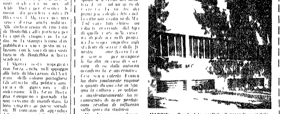
MADRID. Questa foto, scattata di nascosto e portata clandestinamente oltre frontiera, mostra uno degli edifici della Città Universitaria «messi in gabbia» per ordine di Franco

Il regime spera così di prevenire occupazioni delle facoltà. Ma il movimento studentesco di opposizione ha già ottenuto successi decisivi