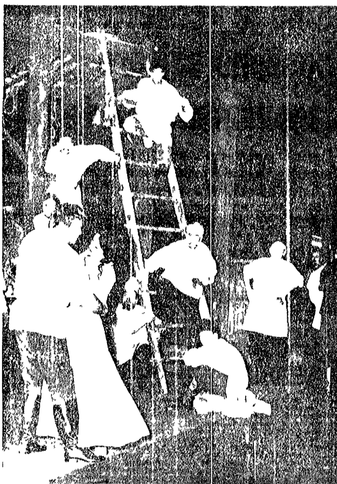
La prima rappresentazione a Firenze di Caterina Ismailova...