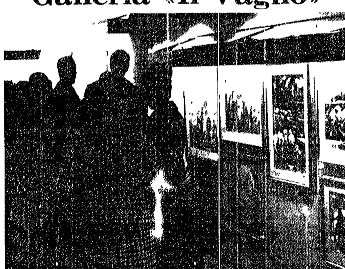
Fino a venerdì la galleria «Il Vaglio» presenta una interessante mostra collettiva...

anteprima nazionale della "nuova produzione 66" del mobile per la casa con