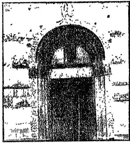
PAVIA Parlicolare della facciata con il portale centrale della basilica di San Michele