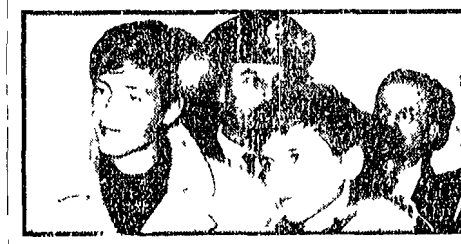
E' stato il tema delle fughe in cerca di avventure sul mare... E' stato il tema delle fughe in cerca di avventure sul mare...

«Noi non eravamo in fabbrica...» «Noi non eravamo in fabbrica...» «Noi non eravamo in fabbrica...» «Noi non eravamo in fabbrica...»