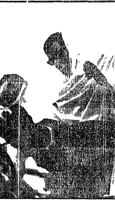
NELLA FOTO Una scena del teatro dei « Poliedrici »

I casi dove fantasia e infelicità spingono a evadere - Le responsabilità non solo dei genitori, ma anche della scuola e della società - Negativo e positivo si intrecciano: bisogna aiutarli a trovare se stessi