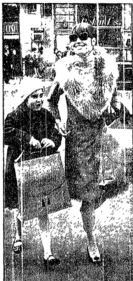
Tempo di acquisti per le feste natalizie. Elsa Martinelli, appena tornata da Parigi, ha fatto l'eroe con la figlia di otto anni, un primo giro nei negozi di Via Condotti e di piazza di Spagna