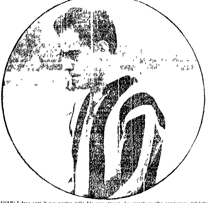
SUARIZ farà oggi il suo rientro nelle file nerazzurre. Le recenti scialbe prestazioni dell'Inter sono state messe in stretta relazione con la sua assenza e pertanto una volta recuperato il suo cervello la squadra milanese dovrebbe ritrovare anche la «forza di concentrazione» necessaria per superare facilmente l'ostacolo Dinamo.