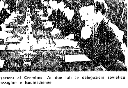
MOSCA 11. Non apprezzano il fatto che Boumediene in qualità di Capo del governo algerino abbia riservato al nome sovietico la sua prima visita ufficiale fuori del continente africano. Ha dichiarato il Presidente del Soviet Supremo Leonida Breznev che il suo governo appoggia il movimento di liberazione del popolo algerino. In alto: il ministro degli Esteri algerino, Abdelkader Boukhalil, con il ministro sovietico degli Esteri, Andrej Kossighin

Unità di vedute sulla necessità di lottare contro il colonialismo, contro ogni focolaio di guerra, per porre fine all'aggressione americana