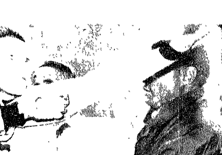
ANQUETIL correrà al Giro per prepararsi al Tour