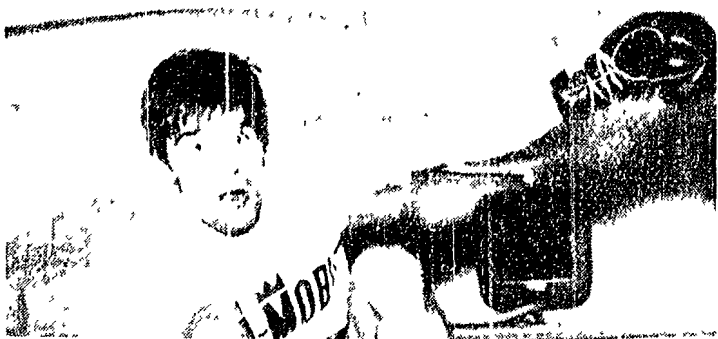
I due protagonisti della pugilato di domani sera. In alto il campione del mondo dei medi jr NINO BENVENUTI sulla cui buona condizione qualcuno si vanta del tutto. A fianco SANDRO MAZZINGHI o sfidante che spera (senza ragione?) di rovesciare il bronzo siculo che lo vuole nuovamente battuto.

Dalla nostra redazione Il derby di calcio tra San Siro e Inter ha avuto un epilogo che è stato per tutti i giocatori e per tutti i tifosi una vera e propria rivelazione. Il fatto che il derby si sia svolto in una condizione di nebbia che ha avvolto il campo di calcio è stato un elemento che ha influenzato il risultato della partita. Oggi a cura di pressa il derby di San Siro ha avuto un epilogo che è stato per tutti i giocatori e per tutti i tifosi una vera e propria rivelazione. Il fatto che il derby si sia svolto in una condizione di nebbia che ha avvolto il campo di calcio è stato un elemento che ha influenzato il risultato della partita. Lois Ciullini