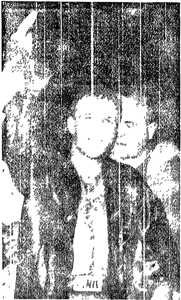
SANDRO MAZZINGHI lo sfidante spera di riprendere al triestino il titolo che è stato costretto a cederlo sul ring di Milano

In palio al Palasport il titolo mondiale dei "medi jr."