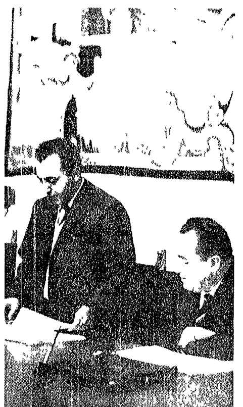
La presidenza del convegno

Il convegno ha visto la partecipazione di numerosi artigiani e rappresentanti delle associazioni di categoria. Gli interventi hanno sottolineato la necessità di un'azione coordinata per sostenere il settore artigiano e favorire lo sviluppo economico del territorio.