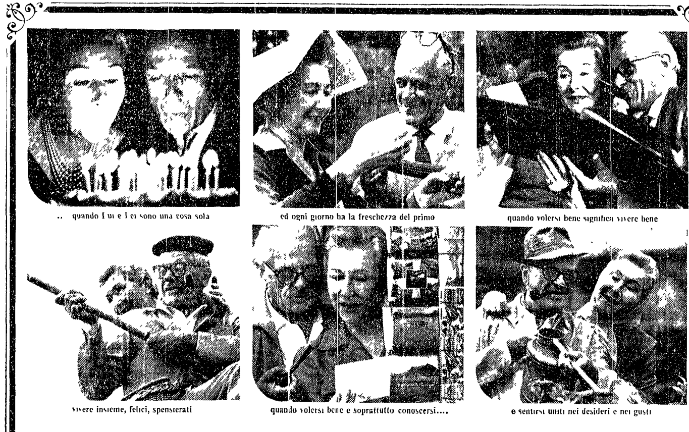
quando l'ui e l'ei sono una cosa sola / ed ogni giorno ha la freschezza del primo / quando volersi bene significa vivere bene / vivere insieme, felici, spensierati / quando volersi bene e soprattutto conoscersi... / e sentirsi uniti nei desideri e nei gusti

Il Consiglio generale del SIA sindacato dei lavoratori ENI. Il Consiglio generale del SIA sindacato dei lavoratori ENI. Il Consiglio generale del SIA sindacato dei lavoratori ENI.