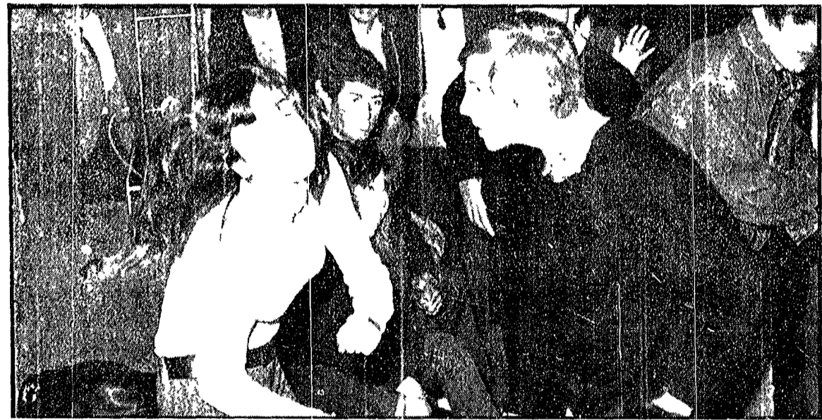
Una scena girata «al vivo» il ballo di due ragazzi al Piper di Roma