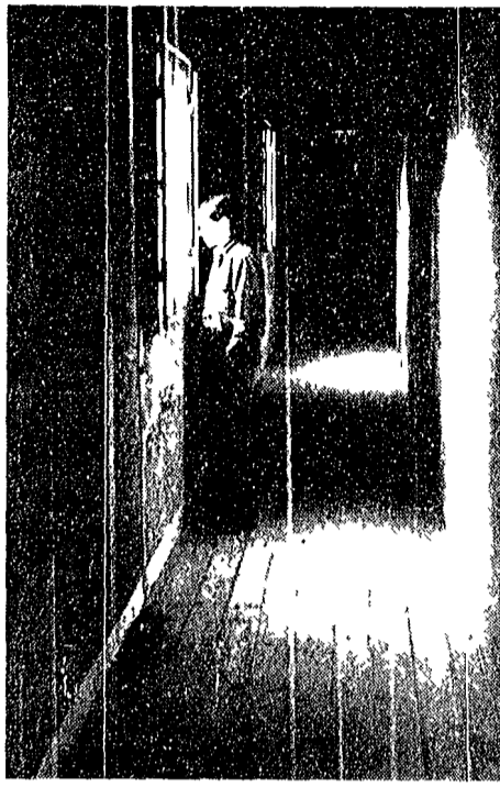
Lo squalido interno di una « abitazione »