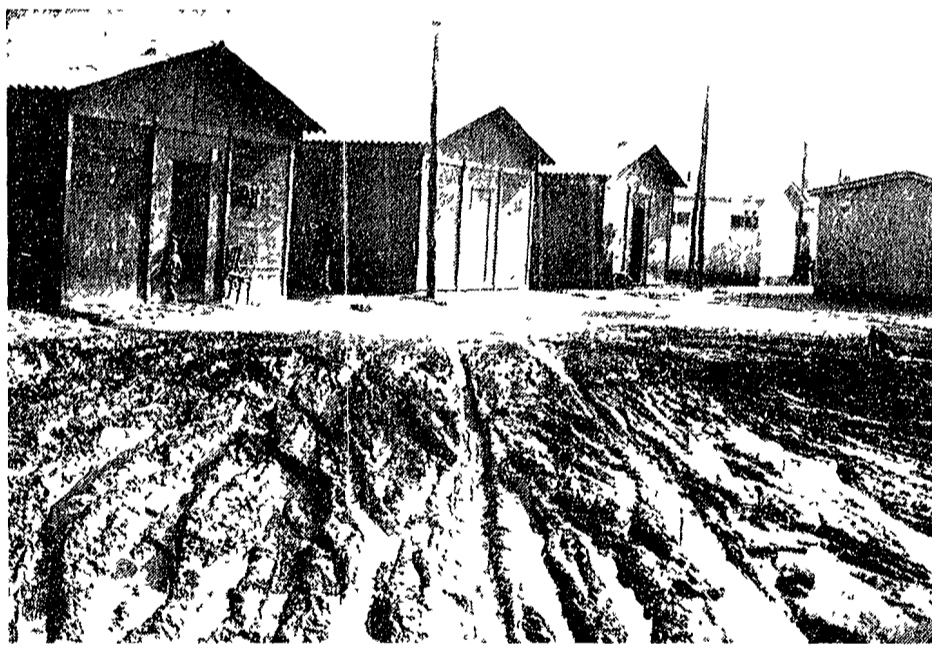
Desolazione e fango tra le baracche del campo del terremotati