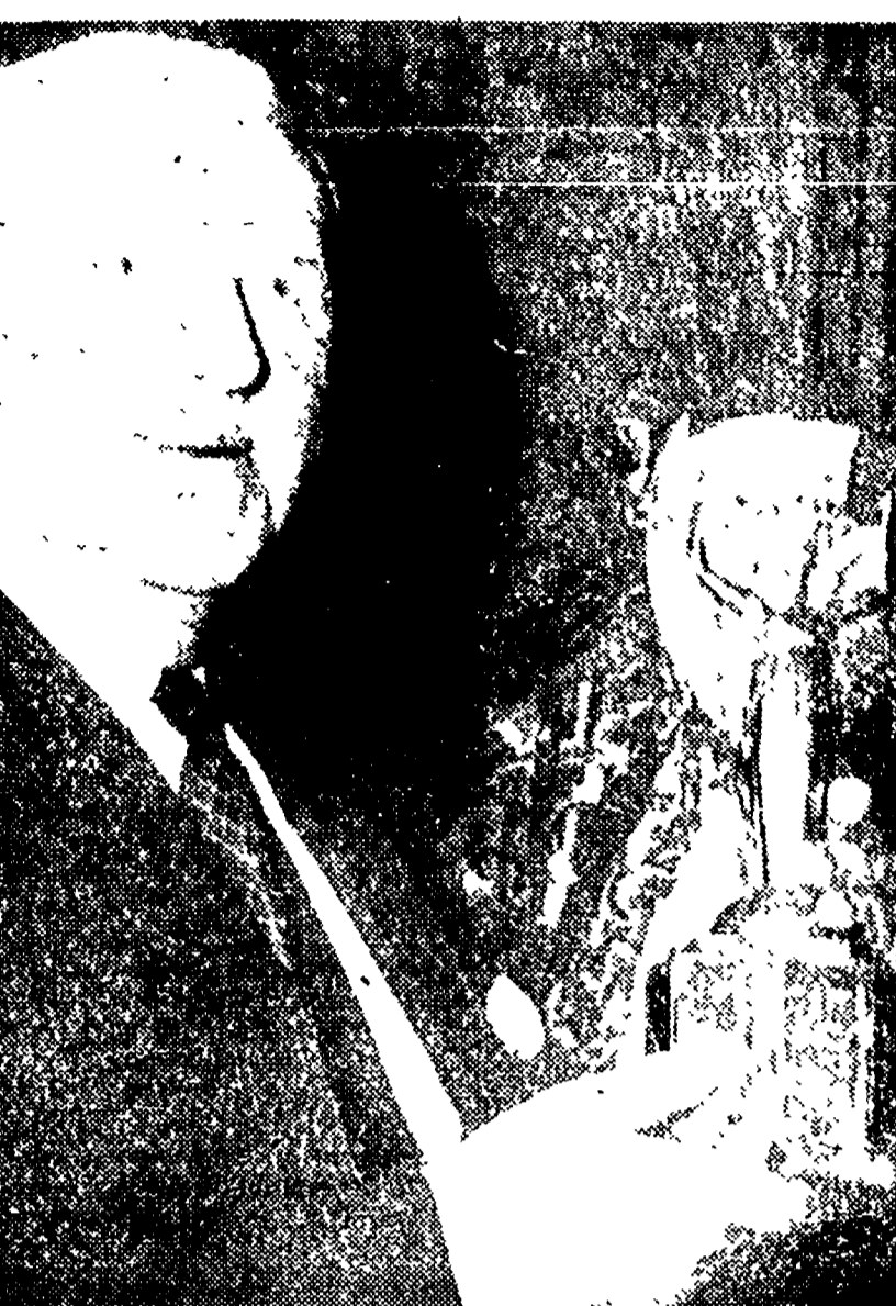
LONDRA - Sir Stanley Rous, presidente della FIFA, fotografato recentemente con la coppa Rimet in mano. (Telefoto)

Centinaia di quadri, di antichi crocifissi, pale d'altare, confessionali, altari, mobili d'antiquariato per un valore commerciale vertiginoso sono stati trovati in istituti dove vennero ricoverati bimbi malati: questa la strabiliante notizia venuta fuori da un'indagine svolta dalla Tributaria, sulla vasta attività di suor Flaviana Venturi, attualmente sotto inchiesta giudiziaria per la casa di cura Villa Mater Gratiae di Santa Marinella, la cui gestione ricorda troppo da vicino quella delle cliniche che hanno fatto incappare Aliotta.