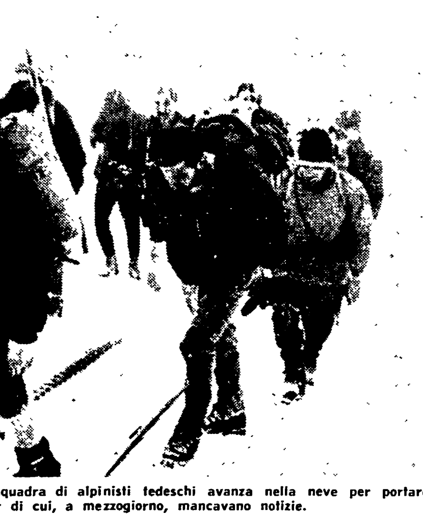
KLEINE SCHEIDEGG - Una squadra di alpinisti tedeschi avanza nella neve per portare scorseggi agli scalatori dell'Eiger di cui, a mezzogiorno, mancavano notizie.