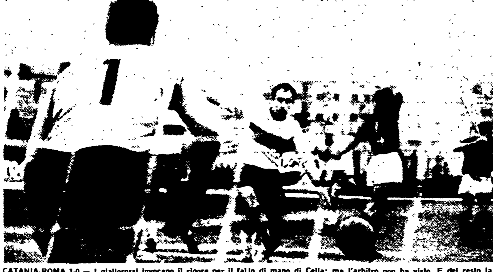
CATANIA-ROMA 1-0 - I giallorossi invocano il rigore per il fallo di mano di Cella: ma l'arbitro non ha visto. E del resto la Roma non avrebbe meritato il pareggio