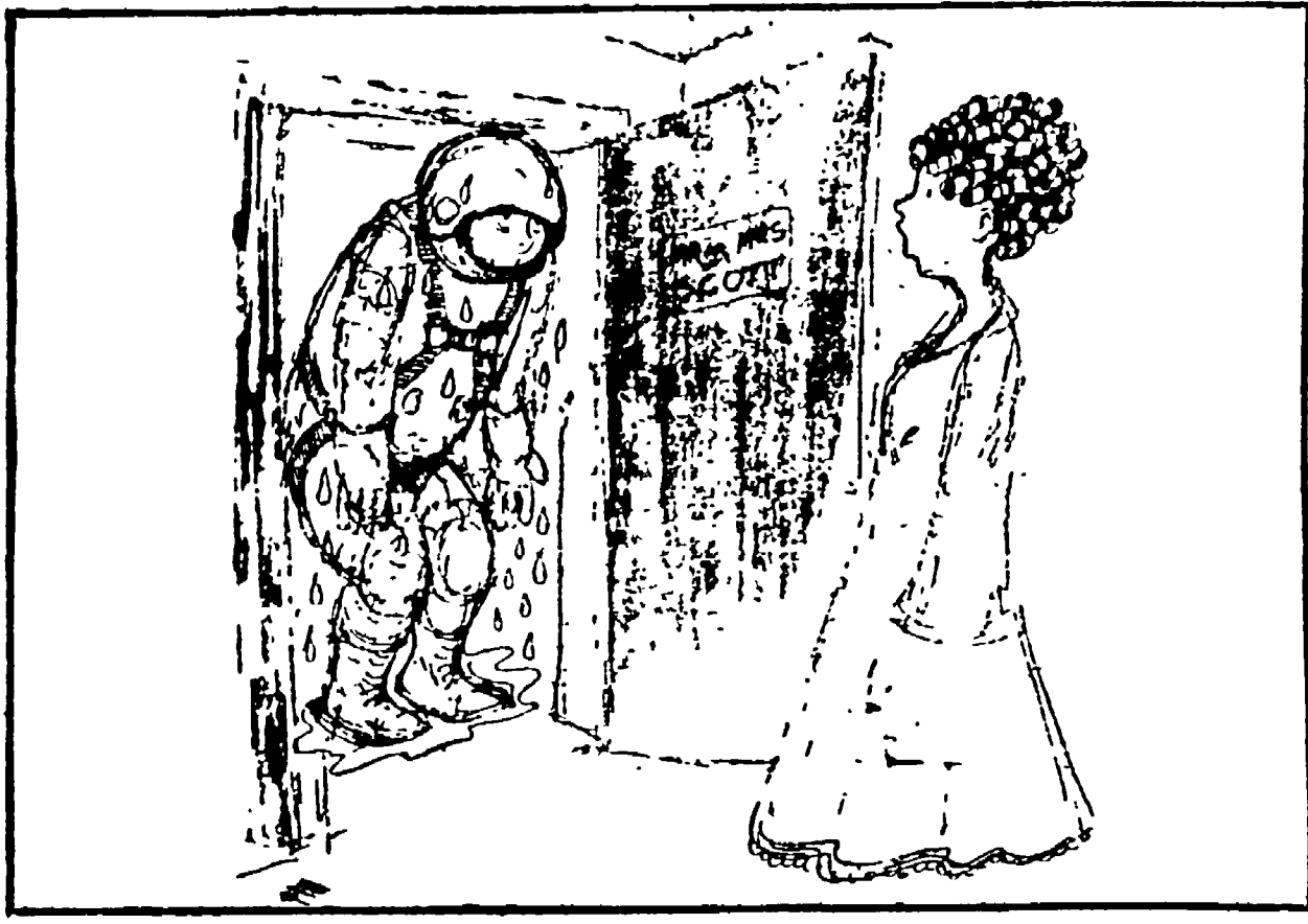
← Cielo, mio marito!

1. VIAGGIATORE: « Leggo qui sul giornale che il Piccolo Teatro di Milano sarà ospite a Berlino del teatro di Bertolt Brecht, e l'avvenimento è considerato eccezionale. Perché? » 2. VIAGGIATORE: « Perché nessuna compagnia straniera ha mai calcato le scene del Berliner Staatstheater, cioè del teatro fondato da Bertolt Brecht nel 1948, e attualmente diretto dalla figlia del grande drammaturgo tedesco scomparso, Helene Weigel. Questo teatro è il più celebre della RDT e fra i più famosi nel mondo. Presentarsi al pubblico di questo teatro, per una compagnia di prosa straniera è un po' come per un balletto est-venuto in Italia ». In Italia, con 51 milioni di abitanti, gli spettatori sono nei teatri appena dieci milioni. Per quanto riguarda il Berliner Staatstheater possono testimoniare che si tratta davvero di spettacoli di alto livello. Per quanto riguarda il pubblico di questo teatro, per una compagnia di prosa straniera è un po' come per un balletto est-venuto in Italia ».