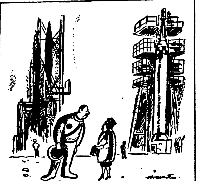
— Chi meglio di tua madre potrebbe badare ai tuoi retrozai, alle piaghe del tuo paracadute e al tuo apparecchio ad ossigeno?... (dal Saturday Evening Post)