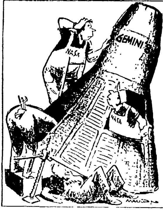
— Ehi Ormai non li fanno più come una volta... (dal « New York Herald Tribune »)