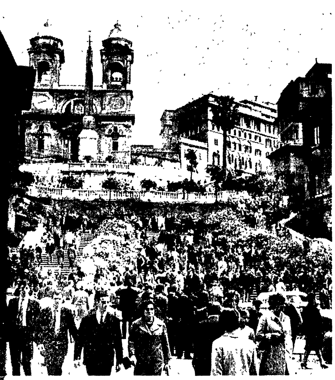
A SINISTRA: La scalinata di Trinità del Monti, ornata dalle tradizionali «stalle», meta preferita dai turisti e dai romani rimasti a casa