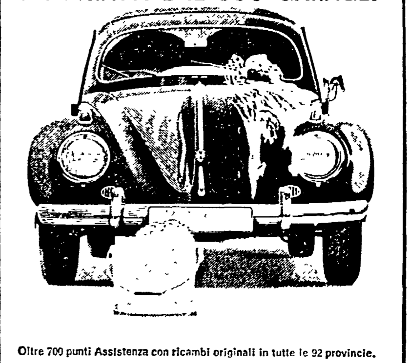
Oltre 700 punti Assistenza con ricambi originali in tutte le 92 province.

Il legame profondo con la « sua » gente, con i braccianti del Sud come con i lavoratori del Nord è stata sempre una delle caratteristiche umane più toccanti del suo compagno di vita Di Vittorio. Vuoi dirci qualcosa su questo aspetto della sua personalità?