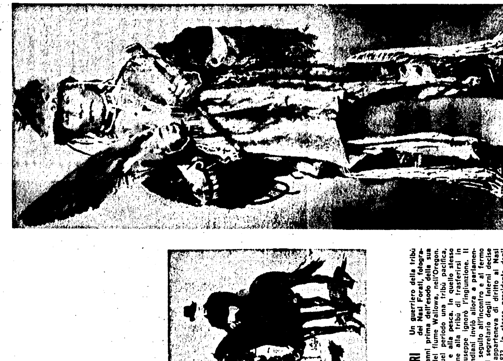
La storia di Capo Giuseppe e dei Nasi Forati è narrata, insieme alla vita di altri famosi esploratori, da Piero Grandi, in un volume di 300 pagine, edito da Longanesi. Il libro è illustrato con disegni dell'epoca, che mostrano i personaggi e i luoghi dell'epoca indiana.