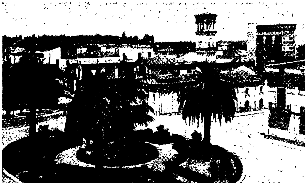
Notro servizio TORRETAGGIORE, 31.

Una profonda tradizione popolare e socialista — La manovra disfattista della DC che ha imposto la gestione commissariale