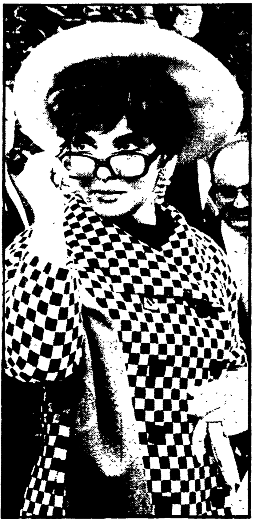
Sguardo malizioso, nel quale si indovina la consapevolezza di essere inquadrata da un obiettivo; cappello a falda larga, soprattutto «op» e occhiali: ecco la «Lola» nei giardini del Quirinale, tutta sola (altorno c'erano solo gli altri 12.900 invitati) in attesa dell'inizio del ricevimento del Presidente della Repubblica.