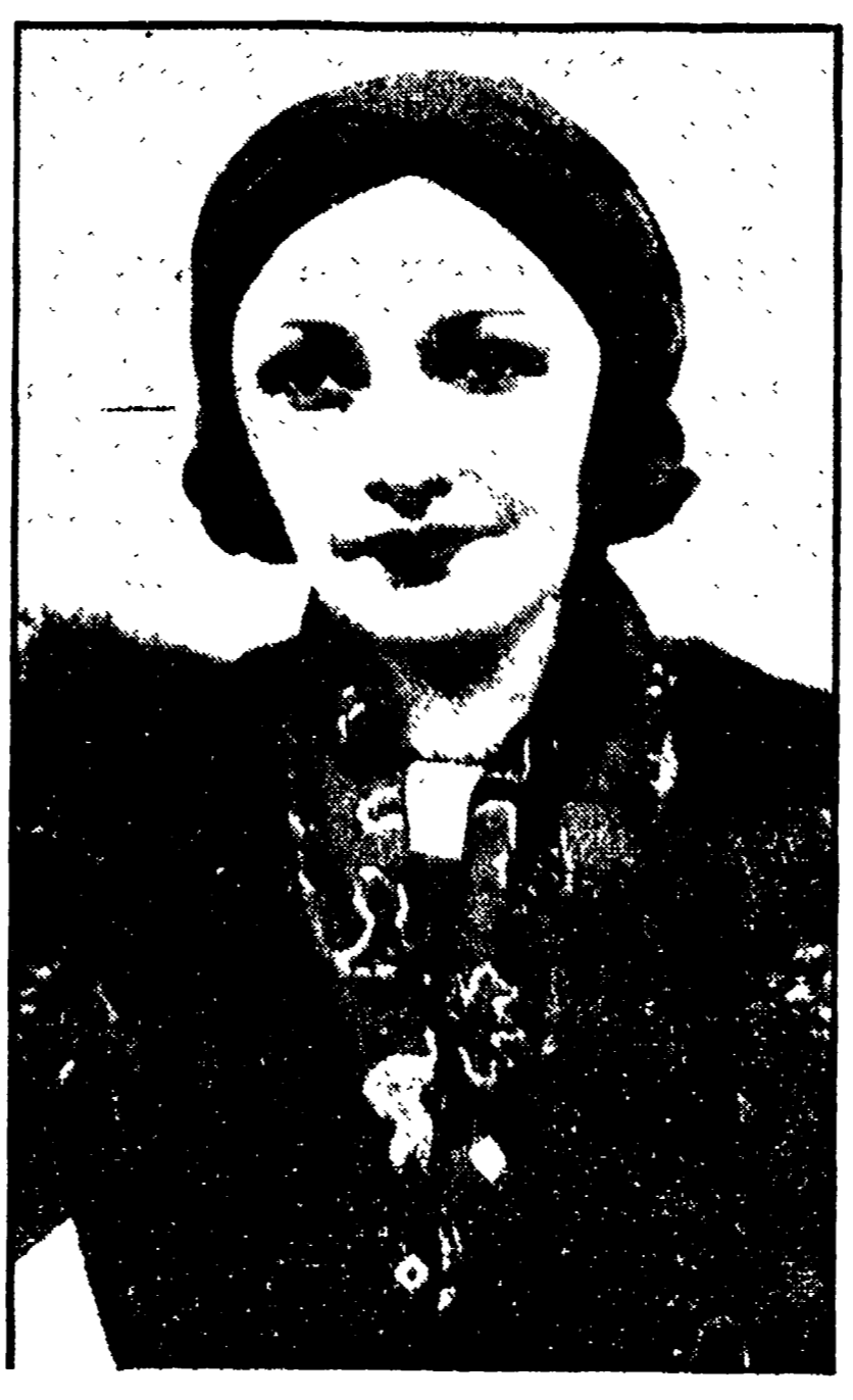
PASADENA (California), 8. L'ultima moglie di Rodolfo Valentino, la bella e fatale Natascia Rambova, anche lei stella del «mulo», è morta all'età di 69 anni in un ospedale di Pasadena.