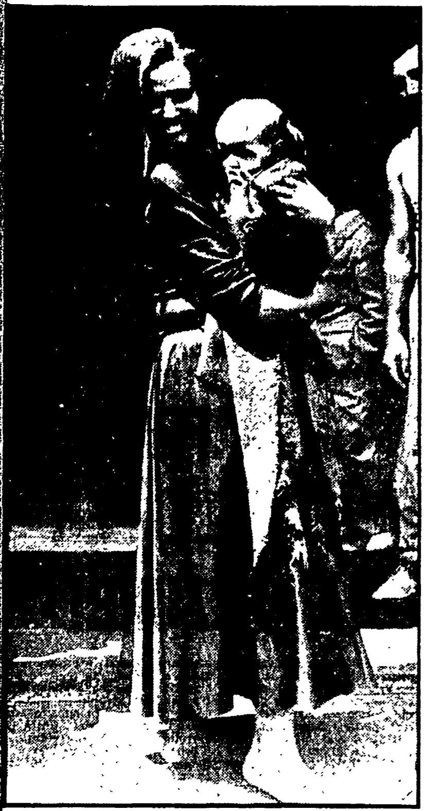
Claudia Cardinale si è presentata ieri in via Veneto abbigliata da zingara... con un bambino in braccio, cercava di vendere ai passanti mazzolini di fiori.

Le industrie deboli si fanno proteggere dai dazi doganali, le musiche fratte dalle percentuali del disegno di legge Corona.