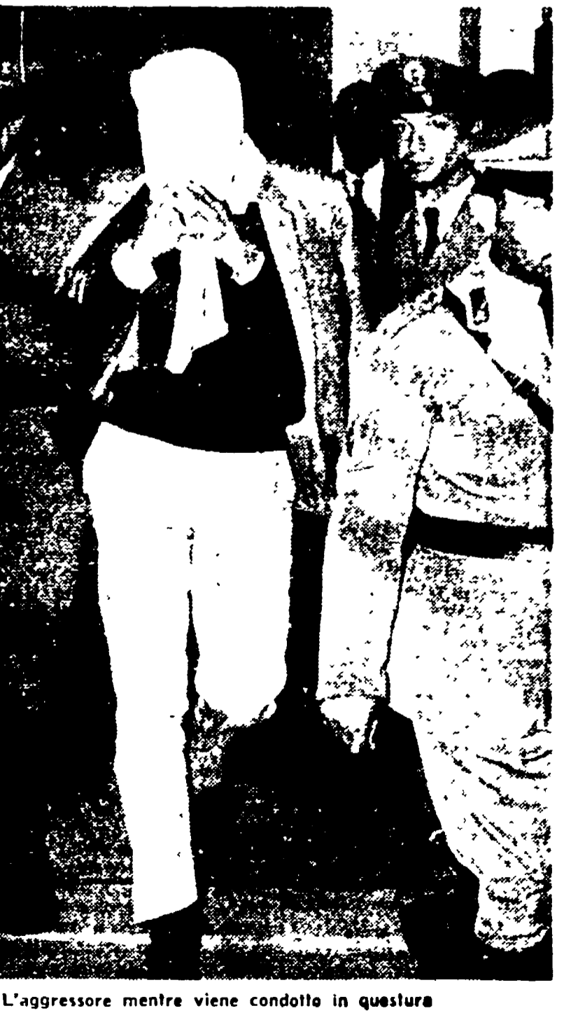
L'aggressore mentre viene condotto in questura