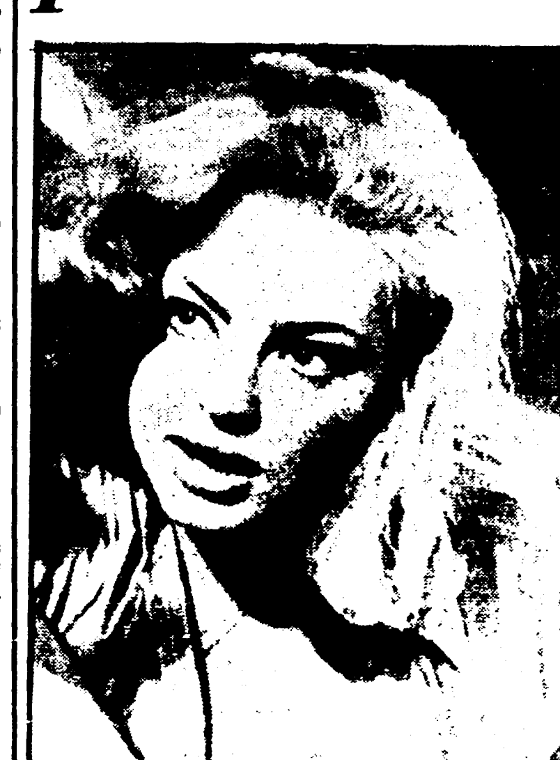
E' stato dato il primo giro di manovella di «Malchess», il nuovo film di Alberto Sordi...