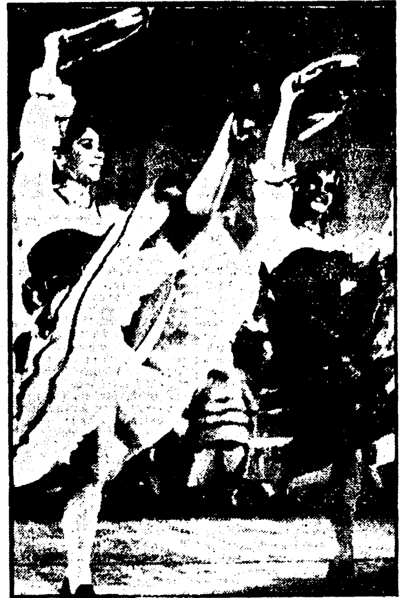
La Compagnia di Stato di danze popolari dell'URSS, diretta da Igor Moisseiev è tornata a Roma, dove, da questa sera...