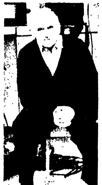
Il maestro Hermann Scherchen