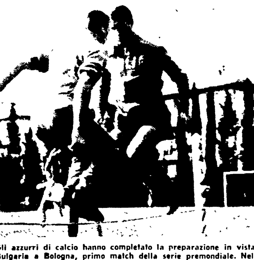
Gli azzurri di calcio hanno completato la preparazione in vista dell'incontro di domani con la Bulgaria a Bologna, primo match della serie premondiale. Nella foto: gli azzurri a Coverciano

La lotta dei metallurgici, che in numerose aziende pubbliche e private - per ultime l'Alfa Romeo, la Siemens e la CGE di Milano - è già in corso contro i tentativi padronali di recuperare la produzione, proseguirà dal 20 con scioperi articolati, per un totale di 12 ore a settimana.