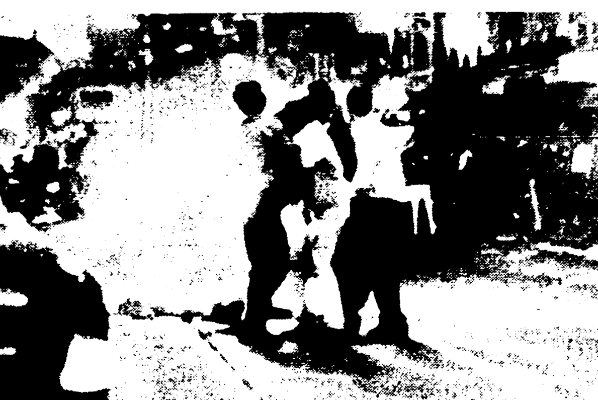
AMSTERDAM - Un migliaio di poliziotti in armi sorvegliano gli incroci, pattugliano le strade principali, presidiano gli edifici pubblici di Amsterdam; in meno di 48 ore, come è già stato riferito, le aggressioni poliziesche contro pacifiche dimostrazioni di operai edili hanno provocato la morte di una persona e il ferimento di altre 46 (di cui una è in fin di vita). La situazione permane tesa, anche se, apparentemente, stamane la calma era tornata in città. Ovunque sono però evidenti i segni degli incidenti degli ultimi due giorni. Lo sciopero di 24 ore proclamato dagli edili si è concluso. E' imminente una riunione straordinaria della Camera dei deputati. Nella foto: un aspetto dei disordini dell'altro giorno.