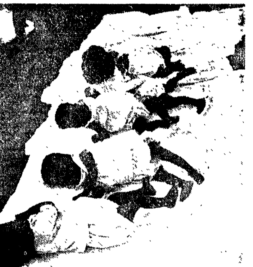
Un orfanotrofio a pochi chilometri da Addis Abeba: in Etiopia la mortalità infantile è spaventosa; alcuni medici europei affermano addirittura che muoiono sette bambini su dieci