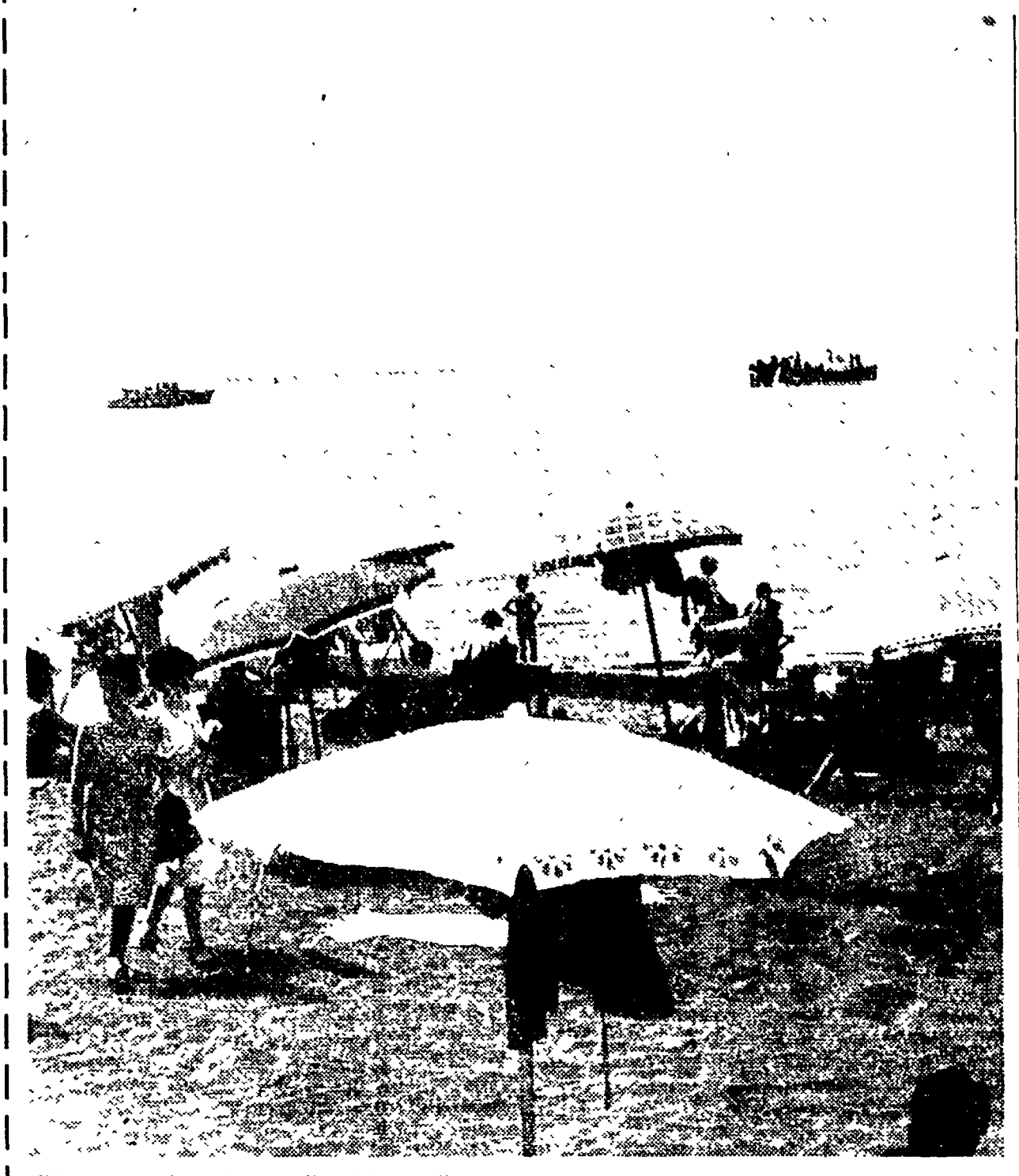
Ultime operazioni di controllo al largo di Ostia: da stamane bagni per tutti

E certo di fronte a quei «quadri», dove il colore rosso e i voti bassissimi erano la nota dominante si rimane un po' stupefatti: ma l'episodio, anche se abbastanza eccezionale investe problemi ben più complessi, relativi in modo specifico alle scuole private, ma anche a quello che rappresenta il liceo artistico romano. Un istituto dove il numero degli iscritti deve essere necessariamente limitato per mancanza di posti, di insegnanti. Forse questa deficiente situazione è stata una delle componenti del triste bilancio scolastico dei 73 studenti?