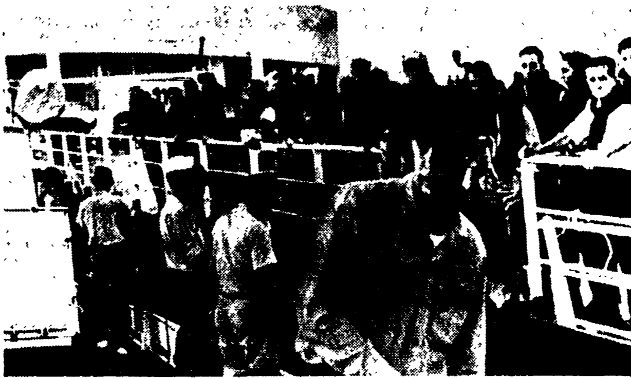
PORTSMOUTH - I componenti l'equipaggio della « Paestum » scendono dalla « Hess Petrol » (Telefoto)

Si tratta della « Paestum », che trasportava 9.500 tonnellate di fosfati - Una falla nella stiva numero due causa dell'affondamento