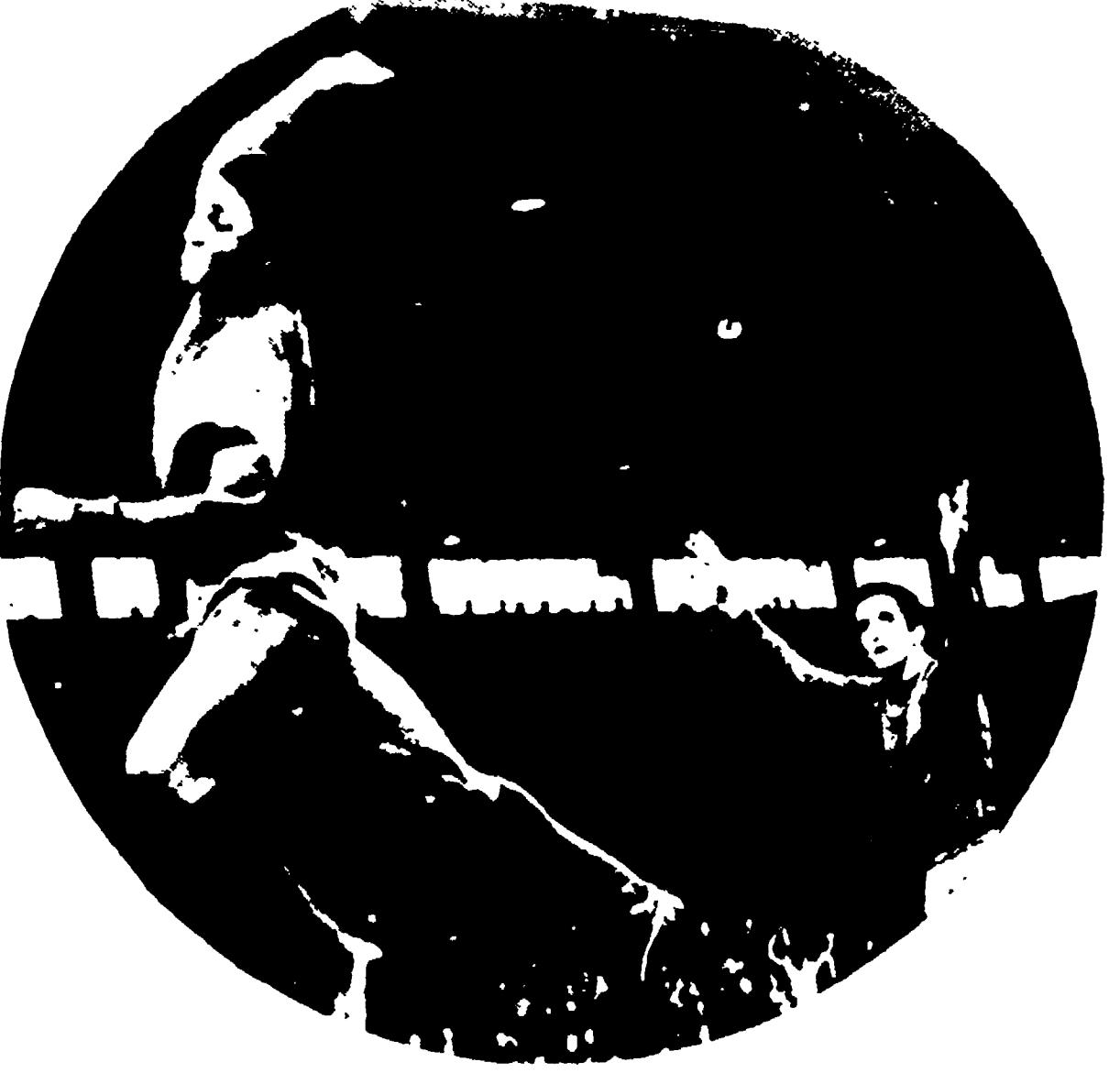
MANCHESTER — Eusebio esulta spiccando un acrobatico salto dopo aver segnato la seconda rete per il Portogallo