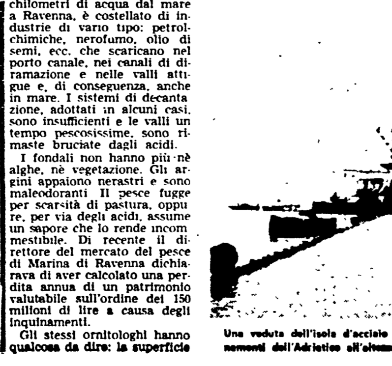
Una veduta dell'isola d'acciaio della SAROM, che per due volte è stata al centro di colossali inquinamenti dell'Adriatico all'ombra della spiaggia ravennate.

DOMANI. Sofia: la capitale bulgara in gara con Varna. Porto Cervo (Sardegna): un paese «inventato». L'isola Zannonne affittata per 5 milioni l'anno.