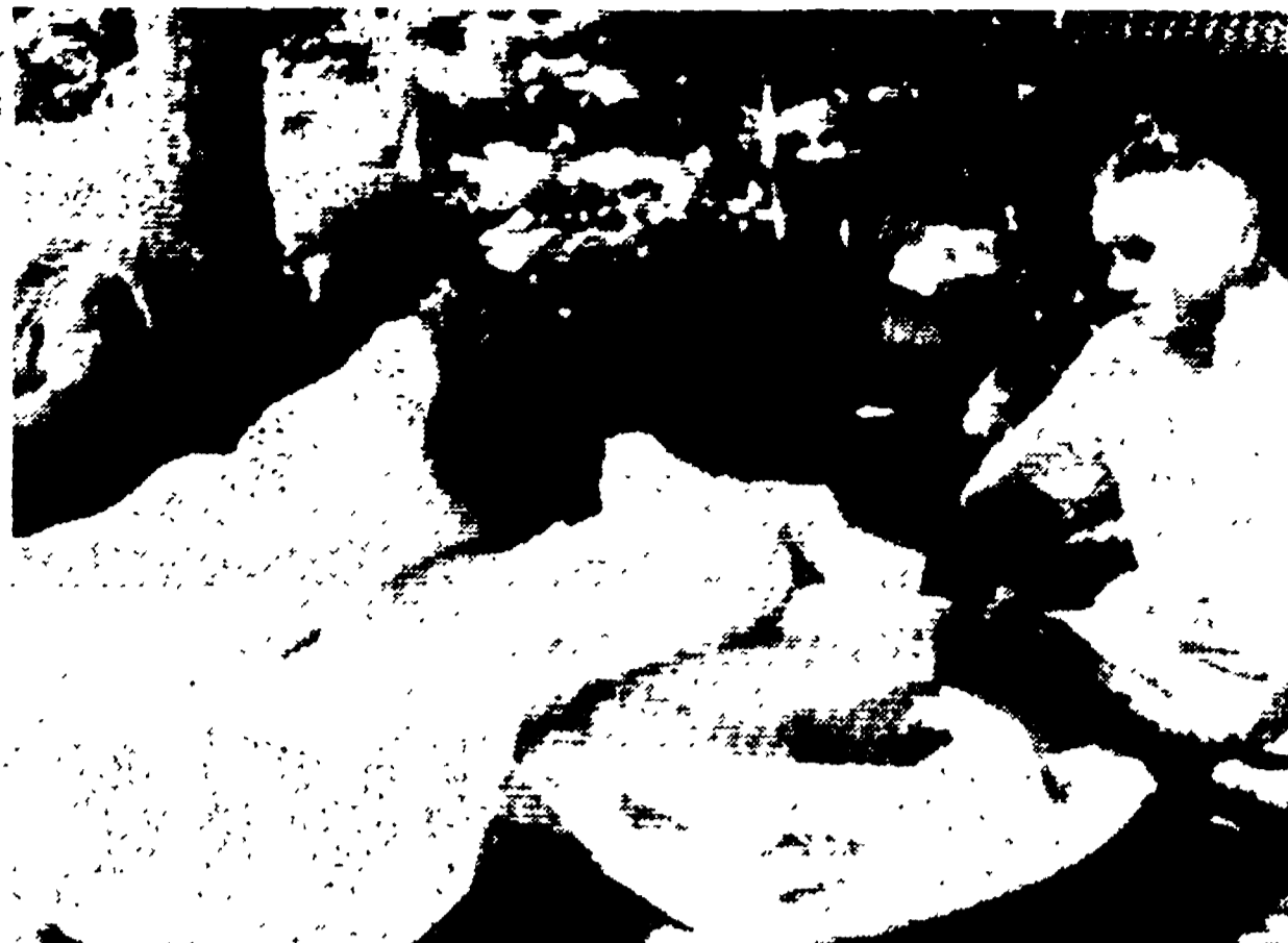
ISTANBUL — Nelle città e nei villaggi distrutti dal terremoto i superstiti vegliano in lacrime, nel desolato panorama di macerie, i propri morti. Nelle telefoto: drammatiche immagini delle zone più colpite.