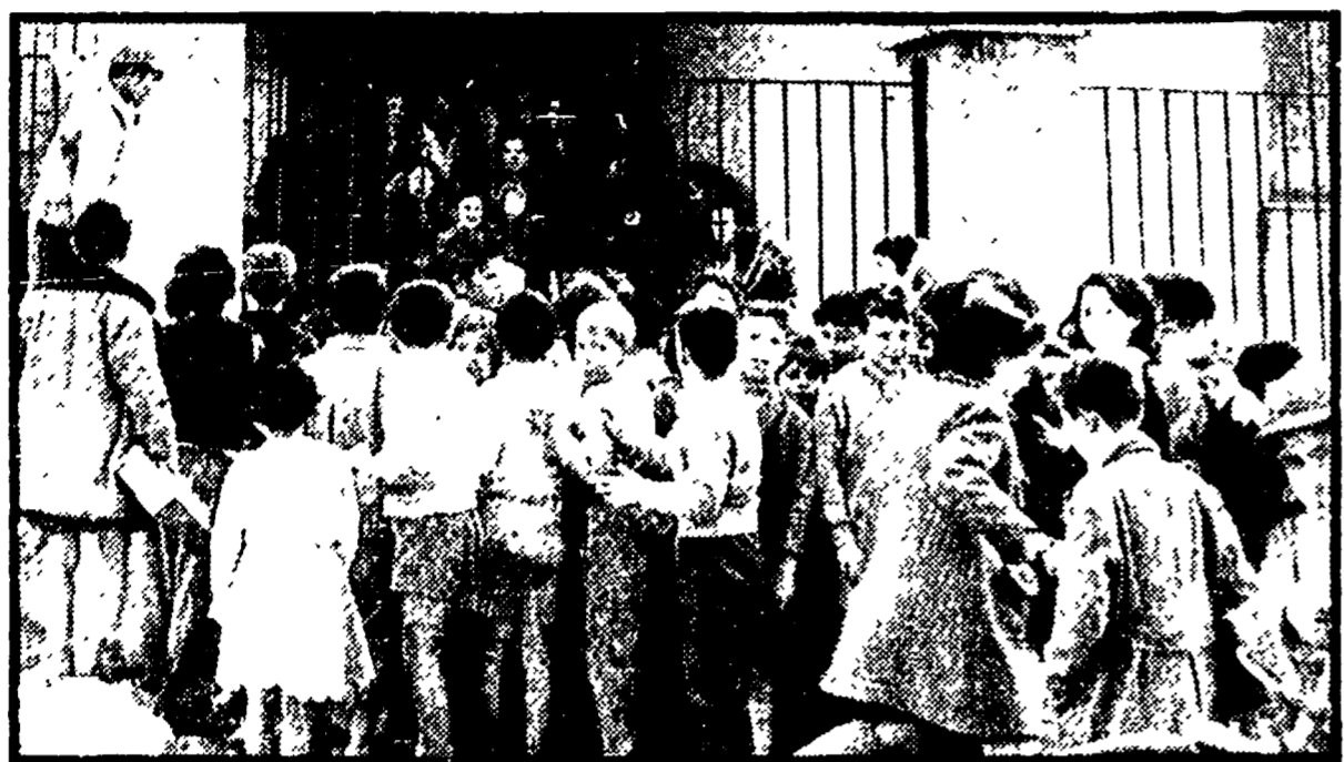
L'entrata di una scuola a Palermo: drammatica, in tutto gravissima, in tutta l'isola, è la situazione sotto il profilo dell'edilizia e dell'assistenza scolastica