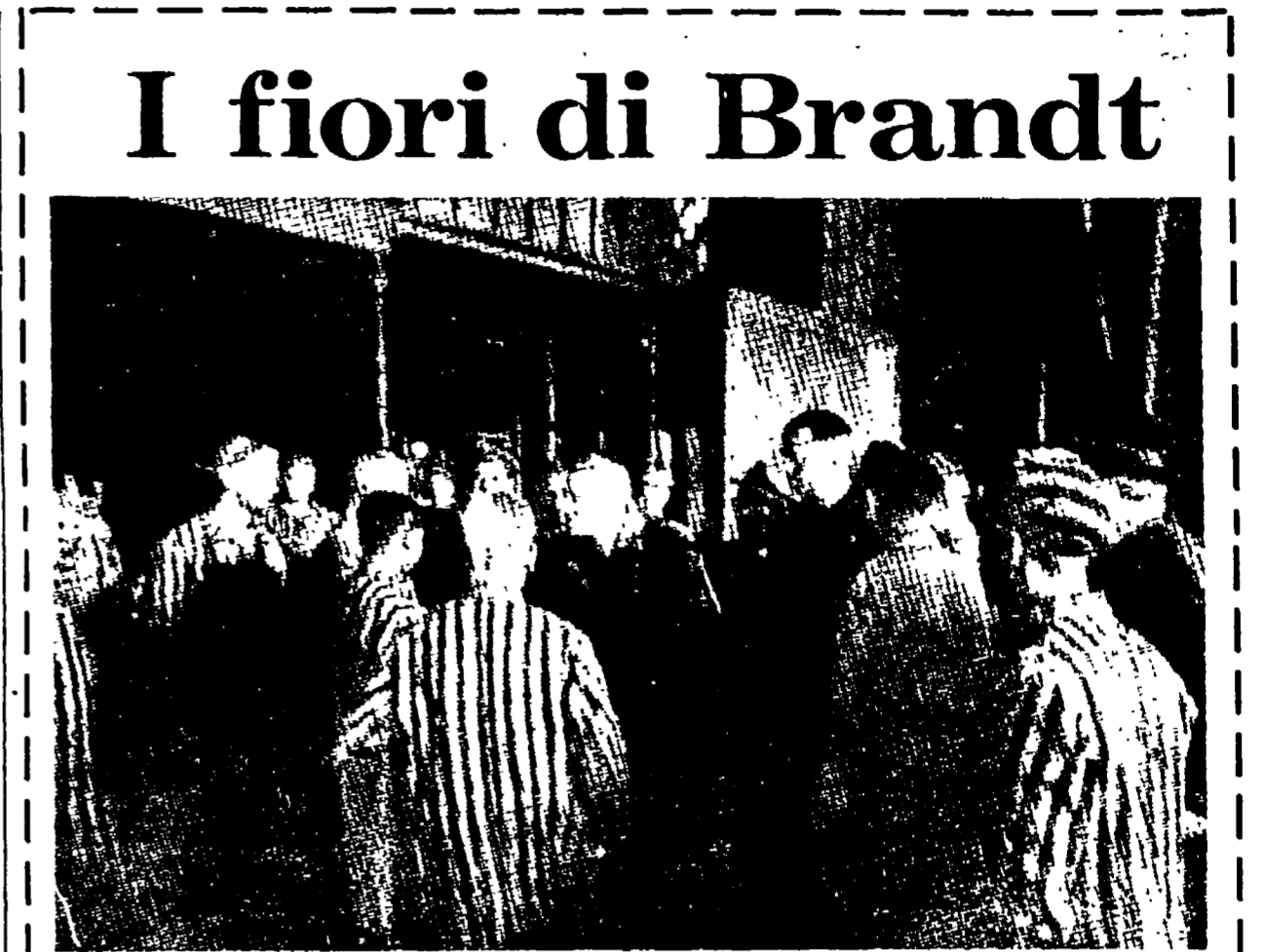
Un raro documento: Speer con altri nazisti in ispezione al campo di concentramento di Mauthausen

AGRIGENTO. 1. Nella zona archeologica di Agrigento è crollato oggi un tratto del muro di cinta del museo nazionale, per una lunghezza di 25 metri.