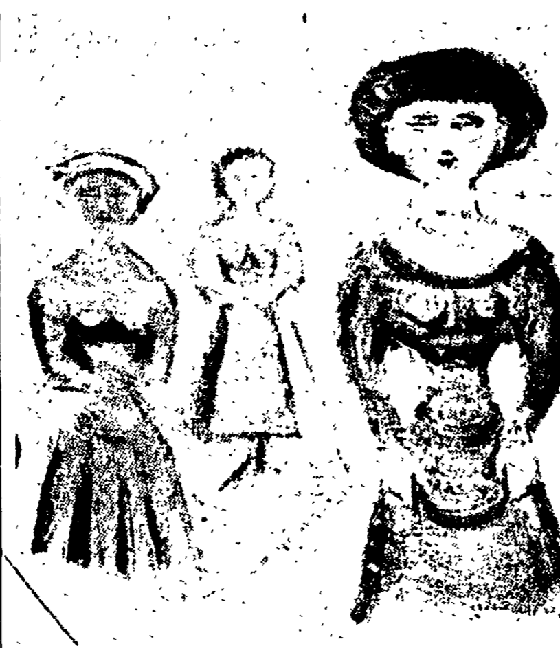
Una delle opere di Campigli esposte ad Ancona

po, così senza spazio. Giriamo lo sguardo da un quadro all'altro e sempre ritorna la stessa tema e anche, in una mirabile sintesi artistica, ritor-