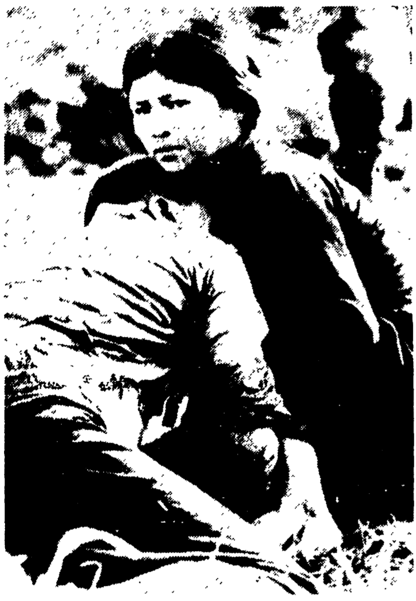
VIETNAM DEL SUD — Il villaggio di Linh Hai è stato nei giorni scorsi teatro di massacri indiscriminati, commessi dalla truppa americana. Nella foto: una donna tiene tra le braccia il marito, un contadino ferito mortalmente, che ora gli americani definiscono «sospetto vietcong». Era senza armi.

Tutti gli apparecchi di tre portaerei impegnati nel bombardamento di Phu Ly, nel Nord - Pesanti perdite USA nel Sud - Protesta dei giornalisti a Saigon per la censura