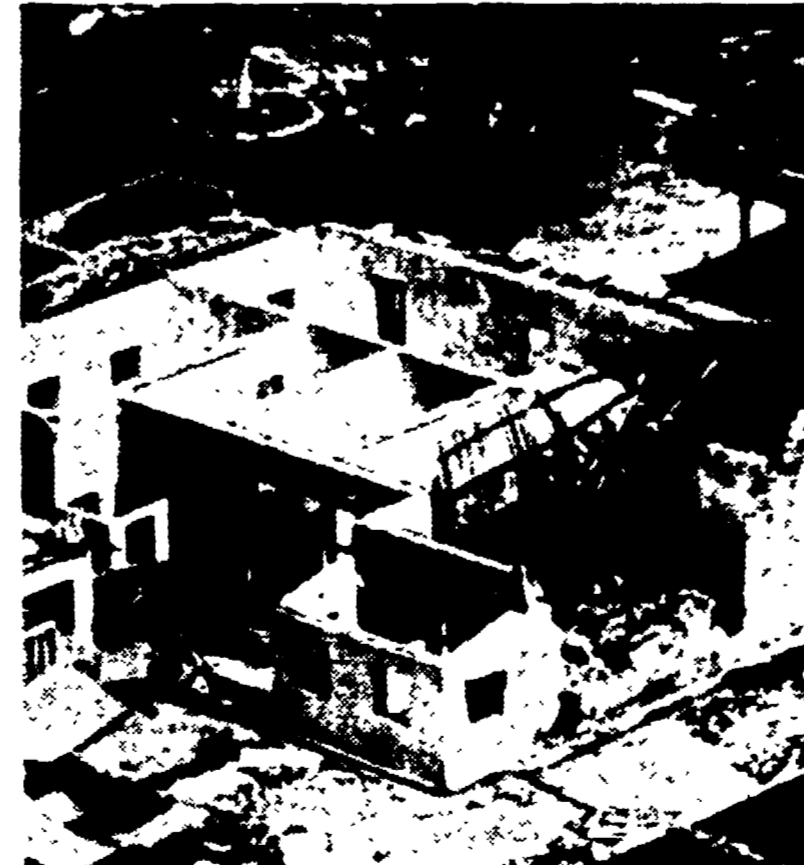
MIAMI, 2 ottobre. «Inez», l'uragano che si è abbattuto con particolare violenza su Cuba, San Domingo e Guadalupa, è rimasto «intrappolato» tra le montagne della regione centrale di Cuba, e stando alle informazioni fornite oggi dal centro meteorologico americano sarebbe ridotto, per ora, ad una tempesta tropicale. Di conseguenza, il presidente che interessa la regione di Miami e quella delle Bahamas è stato sospeso. Secondo le prime previsioni però l'uragano dovrebbe passare a una cinquantina di chilometri da Miami, colpendo alcune zone della