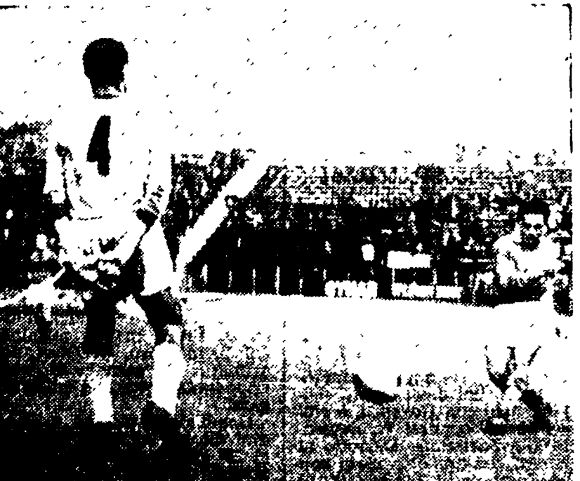
VARESE-CATANZARO — Cucchi segna la seconda rete per i padroni di casa.

MARCATORI: Lorenzini (C) autorete al 38' e Cucchi (V) al 43' del primo tempo.