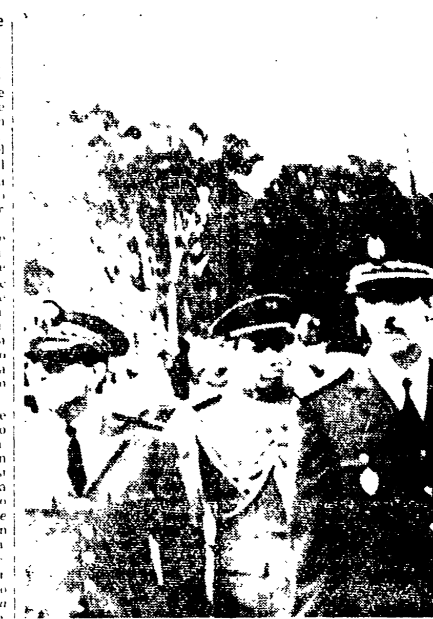
Il ministro degli Interni marocchino Ufkr e il capo della polizia Dimi durante una recente manifestazione militare