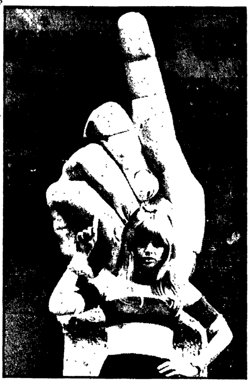
Durante una pausa della lavorazione del film «Bobo», che ella interpreta accanto al marito Peter Sellers, Britt Ekland ha visitato leri, come una brava turista, i musei capitolini...