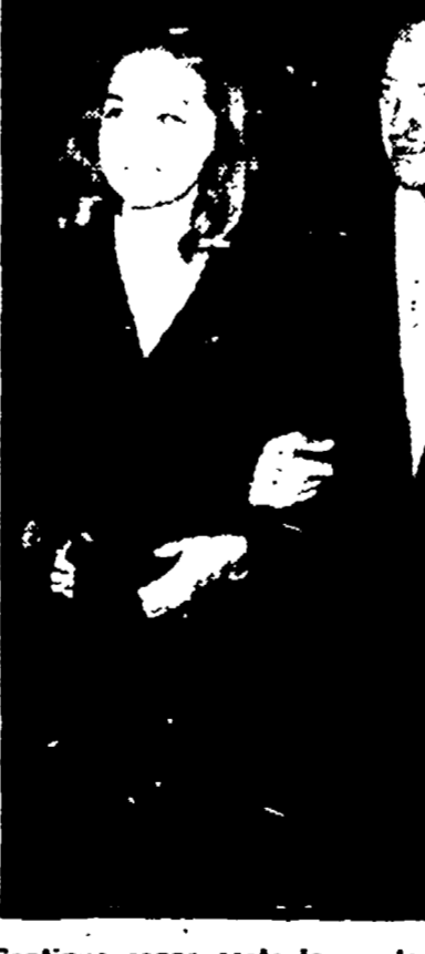
Continua senza soste la «catala» degli attori hollywoodiani a Roma. Sono in questi giorni nella capitale, soltanto per citarne i nomi più noti...