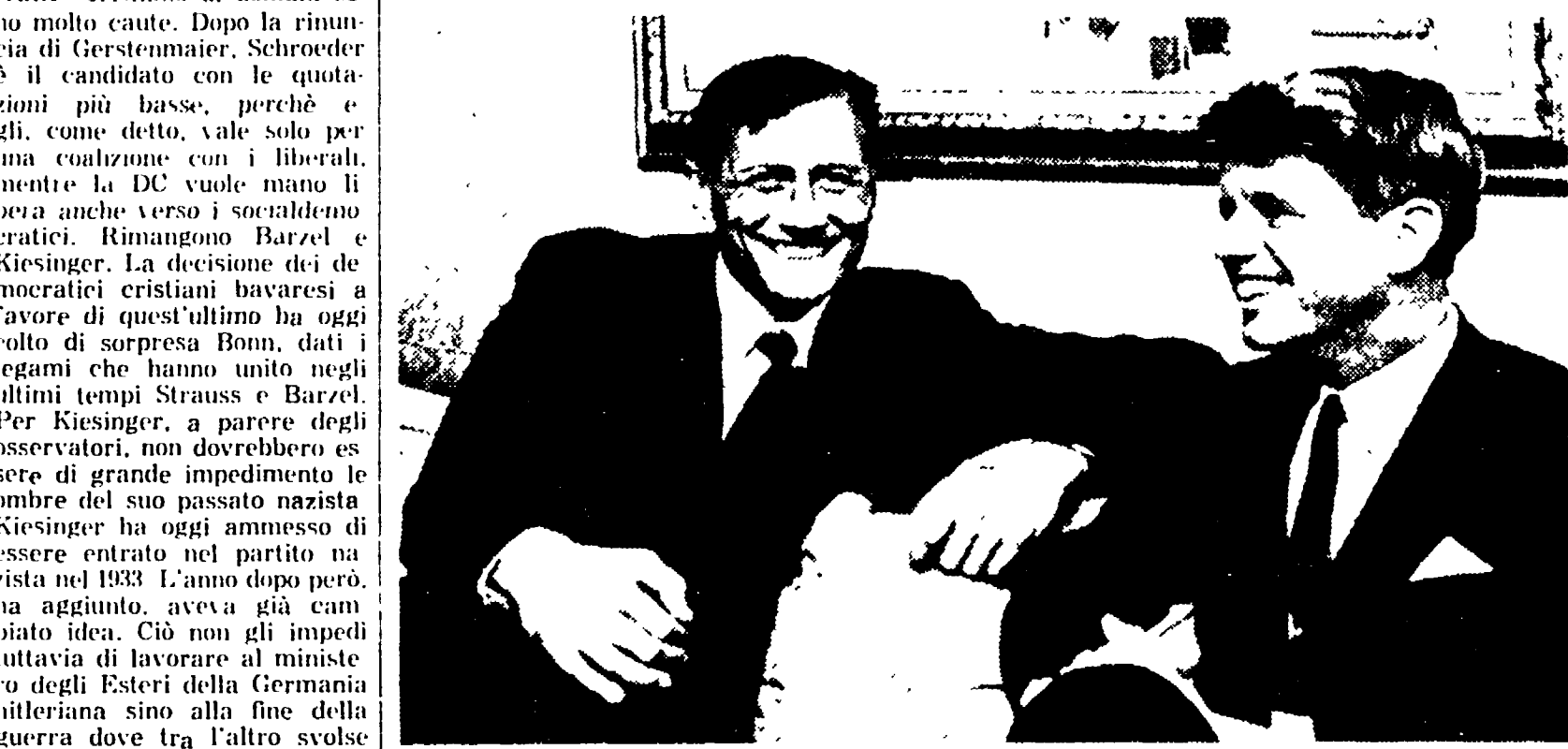
NEW YORK - Il poeta sovietico Evgenij Evtuscenko, attualmente in visita negli Stati Uniti...

A Mosca riprende l'attività diplomatica dopo il 7 Novembre