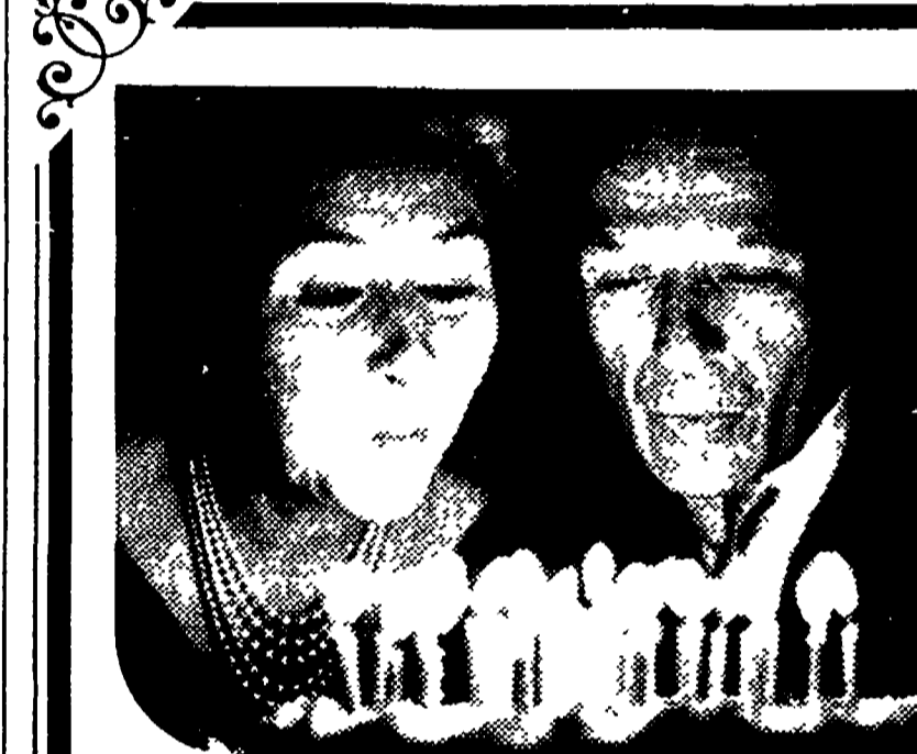
.....quando Lui e Lei sono una cosa sola

Il pubblico ha onorato di apprezzare lo spettacolo offerto dai due pugili, prodigati senza economie in uno scontro continuo e furoso a tratti cupo. Mazzinghi è apparso difficile alla fine dell'undicesimo round quando è finito alle corde sotto gli assalti di un Hoegberg scatenato che il pubblico incantato a gran voce, lanciando «bosse bosse». Nelle due riprese seguenti i pugili sono partiti basati più spinti dalla disperazione di volontà che non dal residuo di energie rimaste loro dopo un combattimento selvaggio. Alla tredicesima il sangue era sulla faccia di Hoegberg e Mazzinghi, sanguinava dall'occhio sinistro. Un elemento che lascia prevedere il vincitore: il gioco di gambe sempre migliore sempre più efficace quello di Mazzinghi innalzato che il respinto del campione. Hoegberg molto grosso nello scorcio dell'incontro.