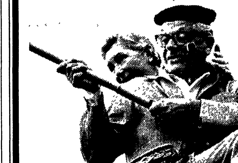
vivere insieme, felici, spensierati