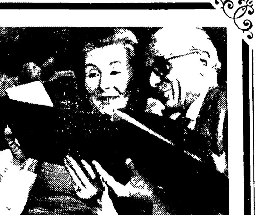
quando volersi bene significa vivere bene