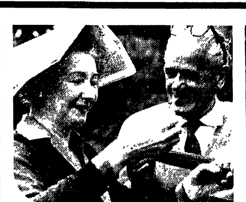
ed ogni giorno ha la freschezza del primo