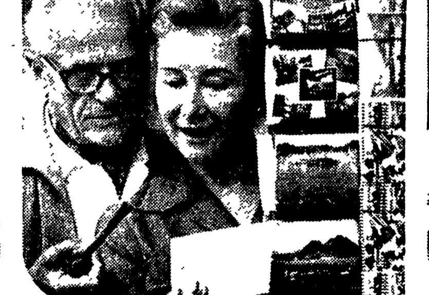
quando volersi bene è soprattutto conoscersi...