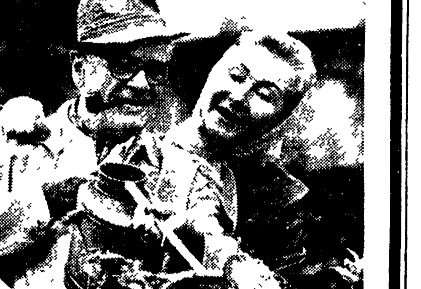
e sentirsi uniti nei desideri e nei gusti