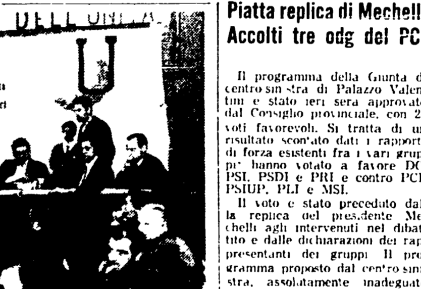
Il programma della giunta di centro-sinistra di Palazzo Valentini è stato approvato dal Consiglio provinciale. Sono presenti i dirigenti provinciali e i dirigenti delle sezioni.