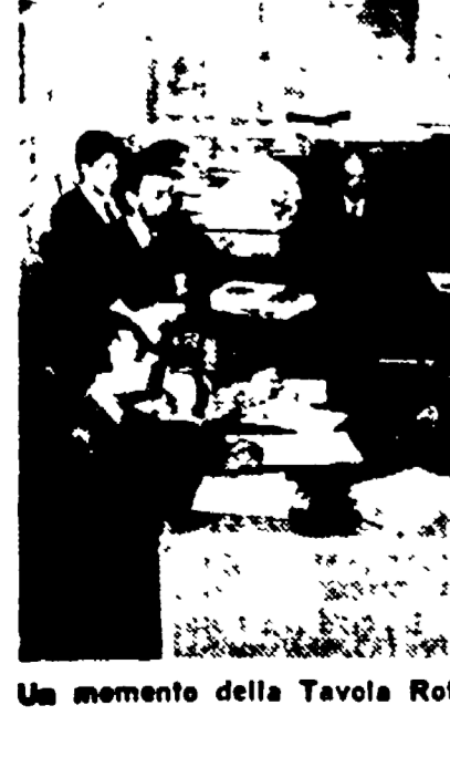
Un momento della Tavola Rotonda dell'Unità

Il progetto di decentramento delle grandi operazioni amministrative è stato approvato dal Consiglio comunale il 27 novembre scorso. Il gruppo comunista di Roma ha presentato al Consiglio comunale un progetto per il decentramento delle grandi operazioni amministrative. Il progetto è stato approvato dal Consiglio comunale il 27 novembre scorso.