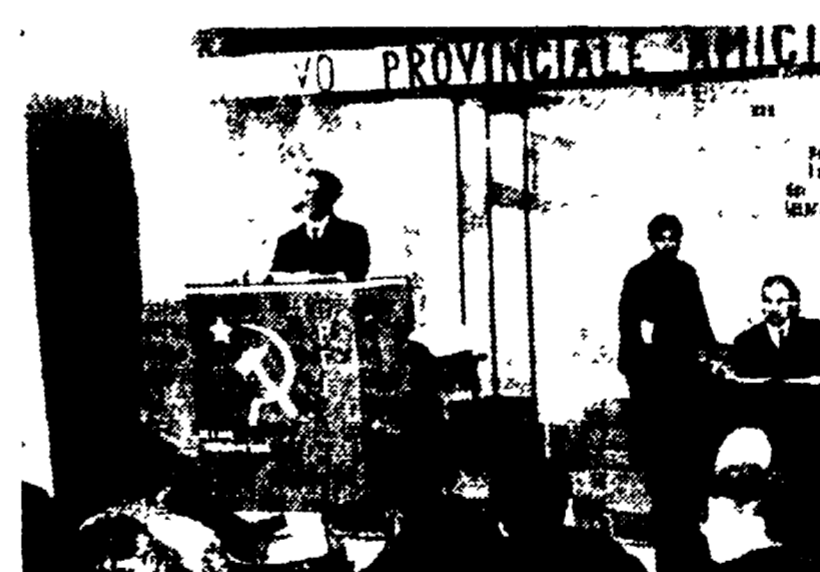
La riunione si è svolta in un'atmosfera festosa. Si è svolta nella grande sala della sezione di Torpignattara. Sono presenti i dirigenti provinciali e i dirigenti delle sezioni.