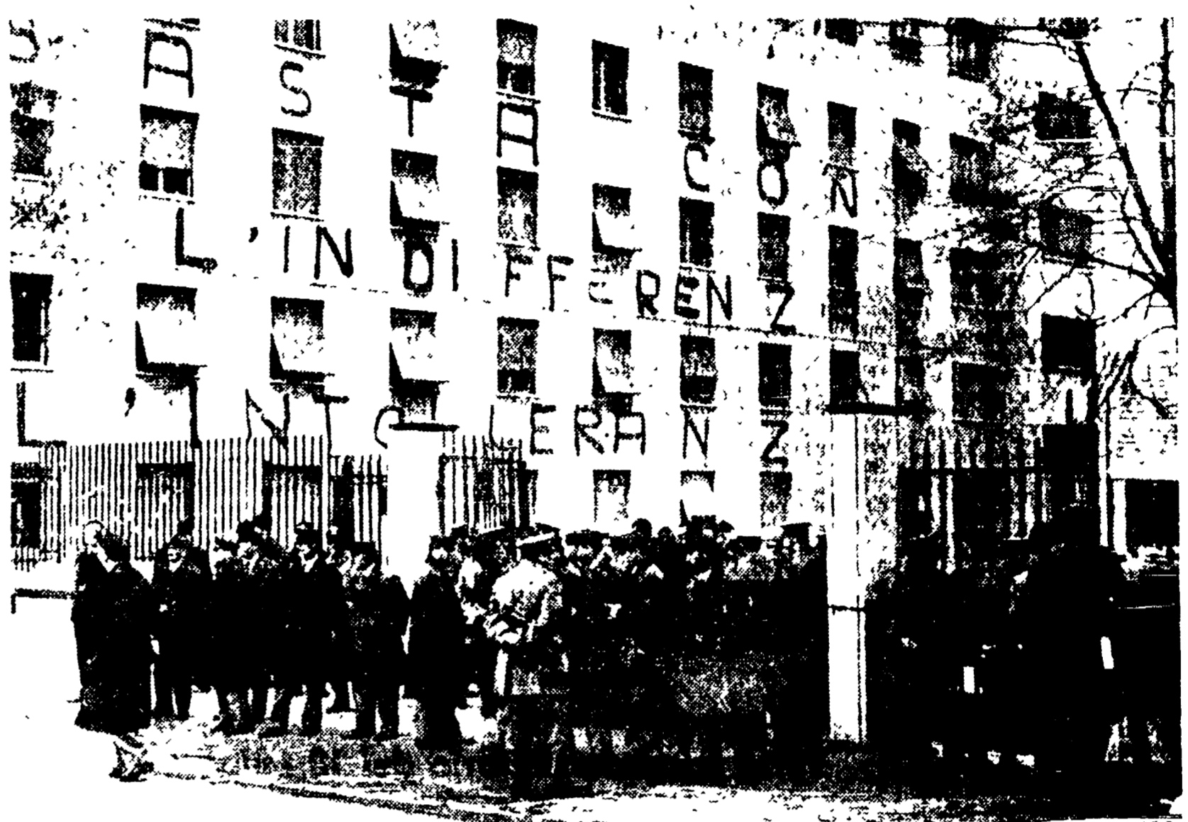
La Casa dello studente, sulle cui mura si leggono le parole d'ordine degli studenti occupanti, assediata dalla polizia

Due universitari feriti nel corso di un brutale intervento della polizia - Si estende la solidarietà - Dibattito indetto dall'Adesspi - Una raccolta di viveri - Nelle «torri» occupate mancano ancora l'acqua e la luce