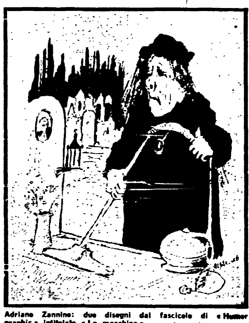
Adriano Zannino: due disegni dal fascicolo di «Humor graphic» intitolato «La macchina»

Non che il scrittore non tenti di costruire situazioni di « incanto », di « magia », di « aria di sottile e di segretezza ».